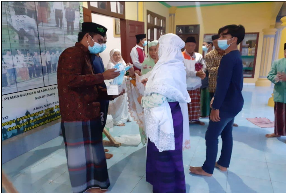
Sosialisasi Penanggulangan Covid-19 Serta Pembagian Masker