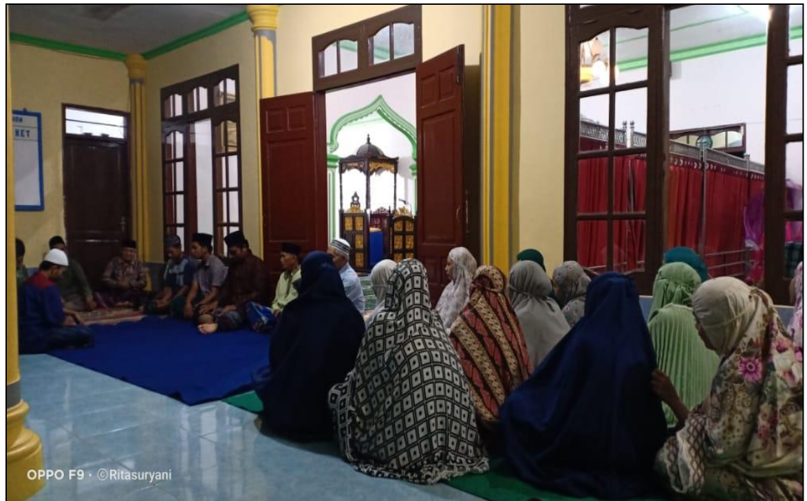
Rapat Bersama Pengurus Desa Beserta Tokoh Masyarakat